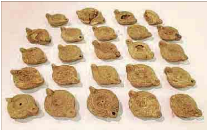
Objectes funeraris de les tombes descobertes a l'Alcúdia.

Aquesta conclusió duu implícita la consideració del destacat rang social dels difunts localitzats, doncs s'enterrarien al costat d'una via de primer ordre.